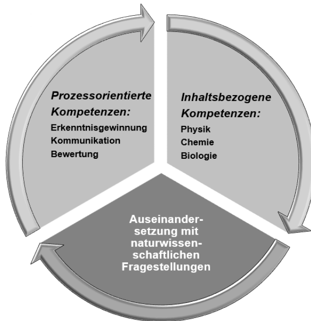
Abb. 1: Kompetenzbereiche der Naturwissenschaften

Der Kompetenzbereich „Erkenntnisgewinnung“ umfasst naturwissenschaftliche Denk- und Arbeitsweisen. Dazu gehören u. a.: