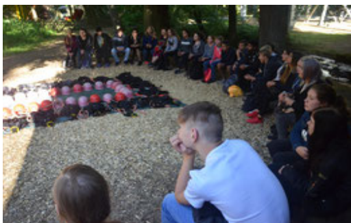
Team des Schülercafés

Es wird von den Teilnehmern dieser Profilgruppe erwartet, dass sie sich aktiv in die Gestaltung des Cafébetriebes mit einbringen und beispielsweise eigene Ideen hinsichtlich der Produktpalette oder Werbung entwickeln. Wir erwarten Zuverlässigkeit, Verantwortungsbewusstsein und freuen uns auf deine engagierte Mitarbeit.